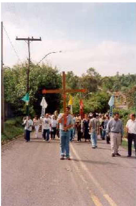
Missões Populares Estigmatinas